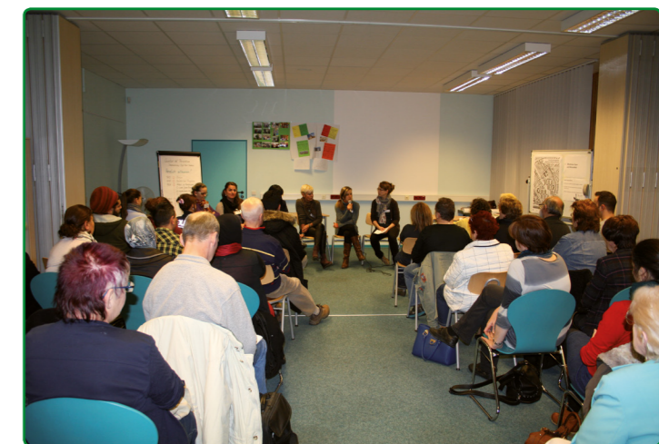
Vorstellung der Soziale Stadt-Projekte zu Beginn des Workshops „Quartier mit Perspektiven“