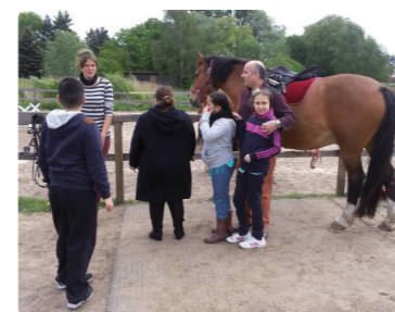
Ausflug der „Sonnenfamilien“ auf einen Reiterhof

Im Dezember findet kein Treffen statt. Nächster Termin 16.1.2015.