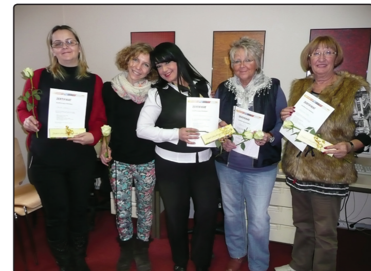
Mediatorinnen mit Ihrer Ausbilderin bei der Zertifikatsübergabe