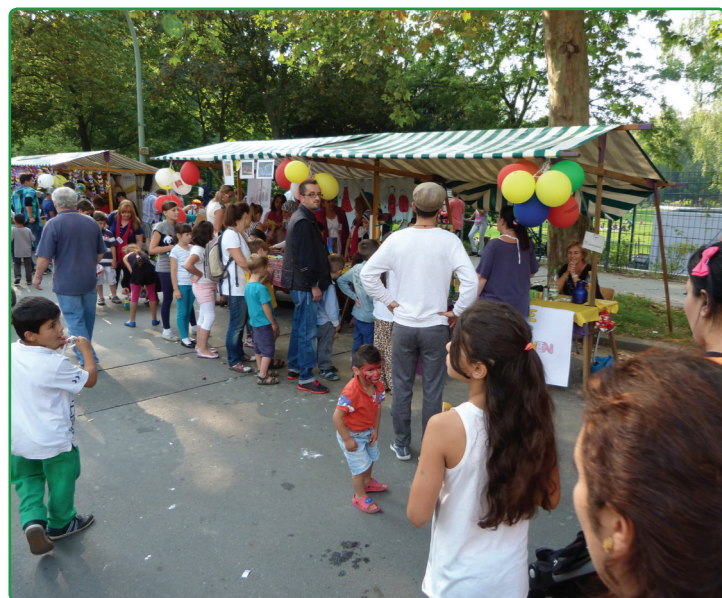
Das Familienfest der Kiez AG wurde 2014 aus dem Aktionsfonds gefördert

Nach wie vor gibt es den Aktionsfonds, in den vergangenen Jahren auch als Quartiersfonds I bezeichnet. Er dient dazu, kleinere und kurzfristige Aktionen von Bewohnerinnen und Bewohnern zu unterstützen. Seit 2014 wird besonderer Wert darauf gelegt, vor allem das ehrenamtliche Engagement zu fördern, um das nachbarschaftliche Miteinander und die Eigenverantwortung der Bewohner zu stärken. 2015 stehen im Aktionsfonds insgesamt 10.000 € zur Verfügung. Neu ist seit diesem Jahr, dass für die Einzelprojekte maximal 1.500 € (bisher maximal 1.000 €) bewilligt werden dürfen. Anträge werden wie gewohnt beim Quartiersmanagement gestellt, das bei der Antragstellung auch gern behilflich ist.