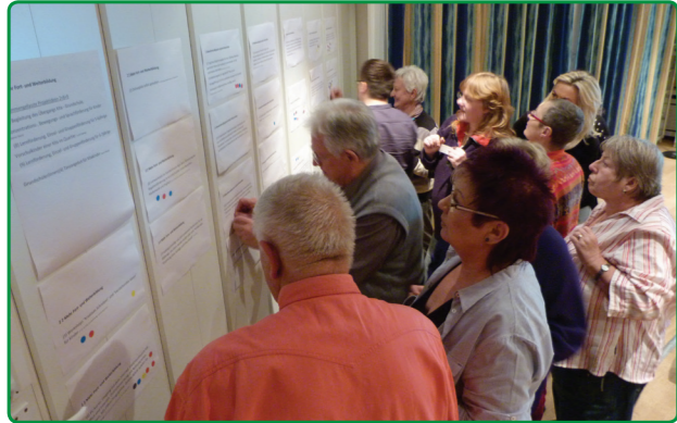
Der Quartiersrat wählt neue Projektideen aus

In unserer Januar-Ausgabe berichteten wir kurz über den Ehrenamts Empfang, der Ende des Jahres in der Aula der Kepler-Schule stattgefunden hatte. Fast 200 Bewohnerinnen und Bewohner der High-Deck-Siedlung waren dazu eingeladen. Sie machen bei vielen Aktionen in der Siedlung mit und tragen damit zu einem guten Miteinander bei. Wir möchten an dieser Stelle einmal etwas näher beschreiben, wo man überall im Quartier unterstützen und mitmachen kann. Eine Möglichkeit sind Räte, Beiräte oder auch Jurys, z. B. der Quartiersrat. Er besteht aus Menschen, die in der Siedlung leben und berät über Möglichkeiten und Wege, das Leben in der Siedlung zu verbessern. Jedes Jahr gibt es Fördergeld für Projekte, über das dieser Quartiersrat mitentscheidet. Wenn im Herbst neu gewählt wird, suchen wir wieder Bewohner, die mitarbeiten.