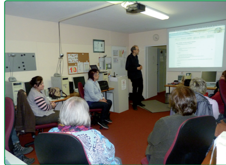
Infostunden im Computertreff sind immer gut nachgefragt

Wer von Ihnen sammelt Briefmarken oder Münzen? Wer hat Interesse, sich auch ab und an mal mit anderen Sammlern aus der näheren Umgebung zu treffen und/ oder auszutauschen oder Sammlerstücke zu tauschen? Gerne können Sie sich im Quartiersbüro (Tel. 68 05 93 25) melden.