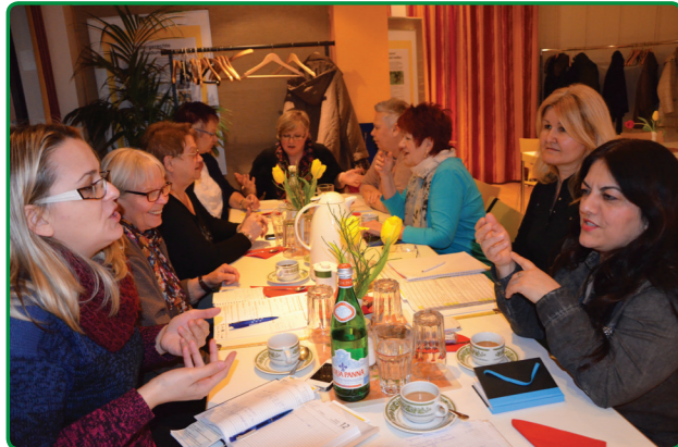
Beratung neuer Veranstaltungen im „mittendrin“-Beirat

Die zwei Mieterbeiräte, einer für die Wohnungen der BUWOG und einer für die Wohnungen der STADT UND LAND, sind Ansprechpartner bei Fragen und Problemen rund um die Wohnung und das Haus. Der Mieterbeirat der STADT UND LAND wird in den nächsten Monaten neu gewählt und sucht Bewohner, die unterstützen. Im mittendrin-Beirat kann jeder mitmachen, der dazu Lust und Zeit hat. Hier trifft man sich alle 6 bis 8 Wochen, um die nächsten Feste im „mittendrin“ zu planen und zu organisieren.