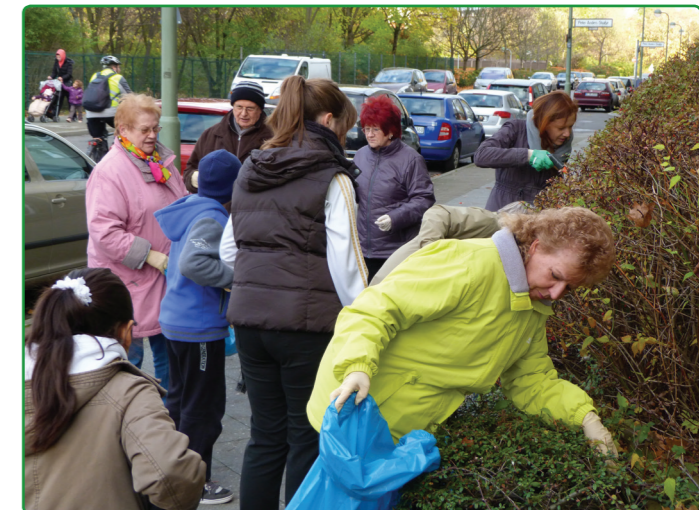
EVM-Bewohner säubern regelmäßig ihr Umfeld und suchen immer Helfer