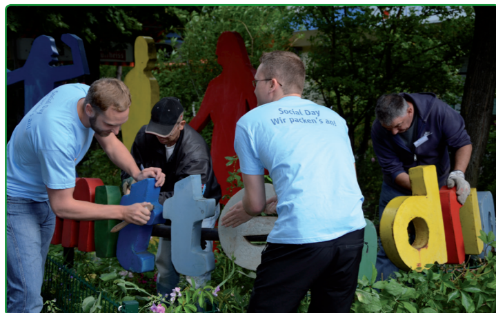
Für alle sichtbar: Der Schriftzug vom „mittendrin“ in neuem Glanz

Montag, 17. August 2014, 16-18 Uhr Boulen: Freizeit-Kugel-Spiel im Freien Alle Bewohner(innen) sind herzlich eingeladen. Treffpunkt: Bouleplatz Sonnenallee/ hinter Michael-Bohnen-Ring 5