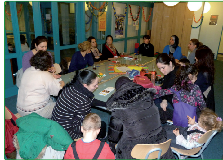
Diskussion im wöchentlichen Elterncafé

Achtung: In den Sommerferien (16.7.-28.8.15) bleibt das Interkulturelle Elternzentrum geschlossen.