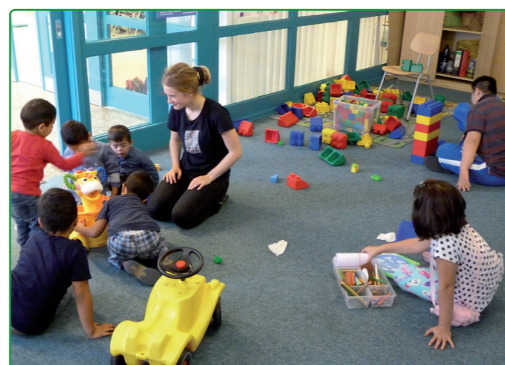
Kinderbetreuung während des Treffpunktes „Sonnenfamilien“