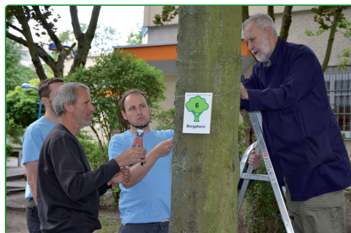
Neu beschriftet: Der Baumentdeckungspfad in der High-Deck-Siedlung

Schon zum zweiten Mal haben 17 Mitarbeiterinnen und Mitarbeiter von ImmobilienScout24 im Rahmen eines Social Days ehrenamtlich zusammen mit kleinen und großen Bewohnerinnen und Bewohnern im Quartier gearbeitet. Von 9 bis 16 Uhr fanden fünf kleinere Projekte statt, die die Siedlung bunter machen und das Engagement für Naturschutz und Umweltbildung unterstützen. Es wurden drei große Insektenhotels für die Kindertagesstätten gebaut, der Baumentdeckungspfad der High-Deck-Siedlung mit Schildern ausgestattet, die Zäune der Kita Highdechsen und des Spielplatzes vor dem Kindertreff „Waschküche“ mit bunt bemalten Schindeln verschönert, die Metallskulpturen vor dem Nachbarschaftstreff „mittendrin“ restauriert und Ziergräser im Spielgarten für Jung und alt gepflanzt.