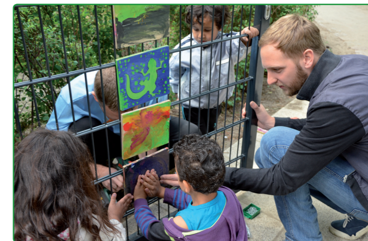
Schön gestaltet: Den Zaun der Kita Highdecks zieren nun von Kindern bunt bemalte Schindeln