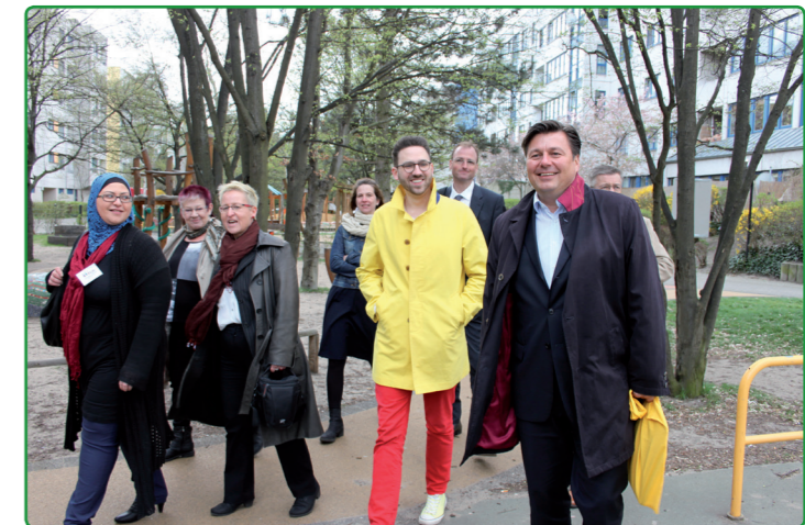
Senator Geisel und Abgeordneter Langenbrinck beim Rundgang durch die Siedlung