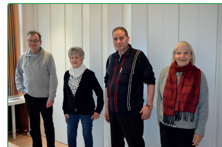
Ehrenamtliche Mediatorinnen und Mediatoren im Quartier