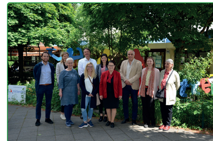
Teilnehmende am Rundgang mit Staatssekretärin Ülker Radziwill im Quartier