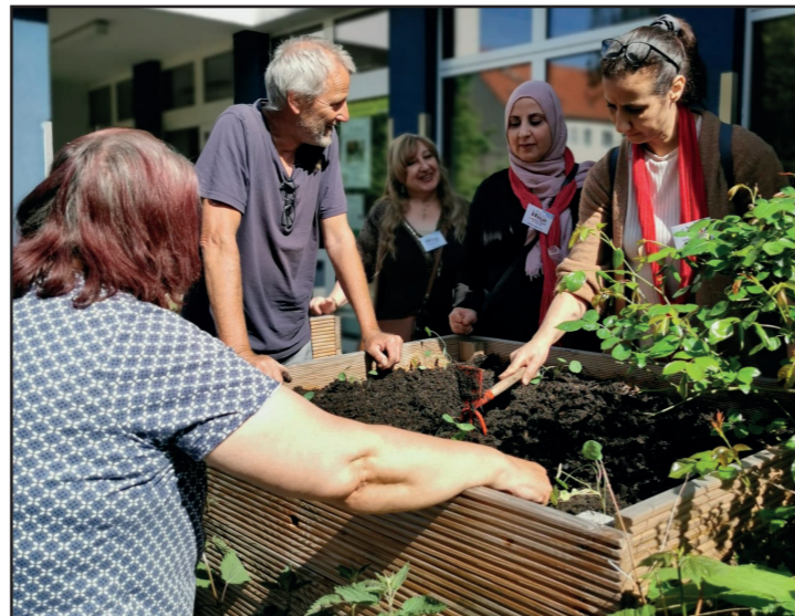
Hochbeete bepflanzen mit den Stadtteilmüttern vor dem Elternzentrum

Aktuelle Informationen entnehmen Sie bitte den Aushängen im Quartier.