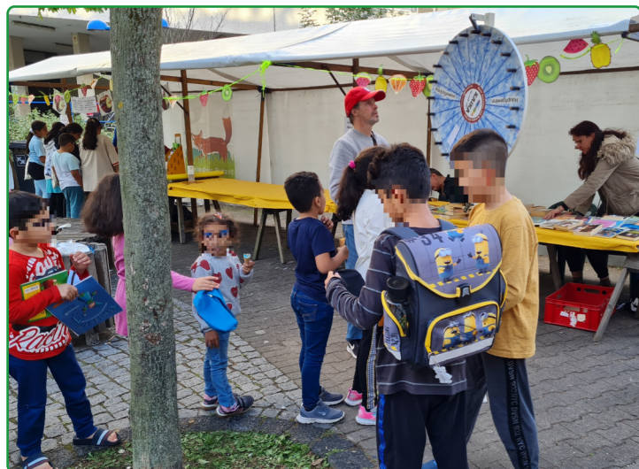
Glücksrad beim Stadtteilfest „KulturenSalat“, finanziert aus dem Aktionsfonds 2022

Auch in diesem Jahr stehen dem Quartier wieder 10.000 Euro zur Verfügung, um kleine und kurzfristige Aktionen in der Nachbarschaft zu ermöglichen. Jedes Projekt kann mit bis zu 1.500 Euro gefördert werden, vorausgesetzt es wird ehrenamtlich organisiert. Die Aktionsfondsjury – bestehend aus ehrenamtlichen Aktiven im Quartier – entscheidet über die Förderung Ihres Antrags. Der Aktionsfonds wird aus dem Programm „Sozialer Zusammenhalt“ finanziert. Wie auch andere Berliner Förderprogramme, zielt auch dieses auf Klimaanpassung und Klimaschutz. Das bedeutet, dass alle Aktionen klimaschonend sein sollen. Sprechen Sie uns einfach an, wenn Sie sich in Ihrer Nachbarschaft engagieren möchten oder eine Idee für eine Aktion haben. Wir unterstützen Sie gerne dabei, einen Antrag zu stellen. Sie erreichen uns telefonisch unter 030 68 05 93 25 oder 0176 301 107 43 oder per E-Mail high-deck-quartier@weeberpartner.de . Wir freuen uns über Ihre Vorschläge!