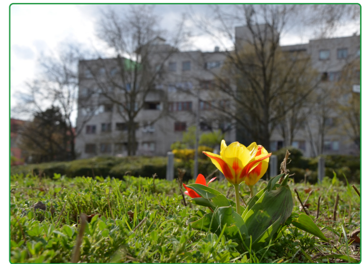
Frühling im Quartier