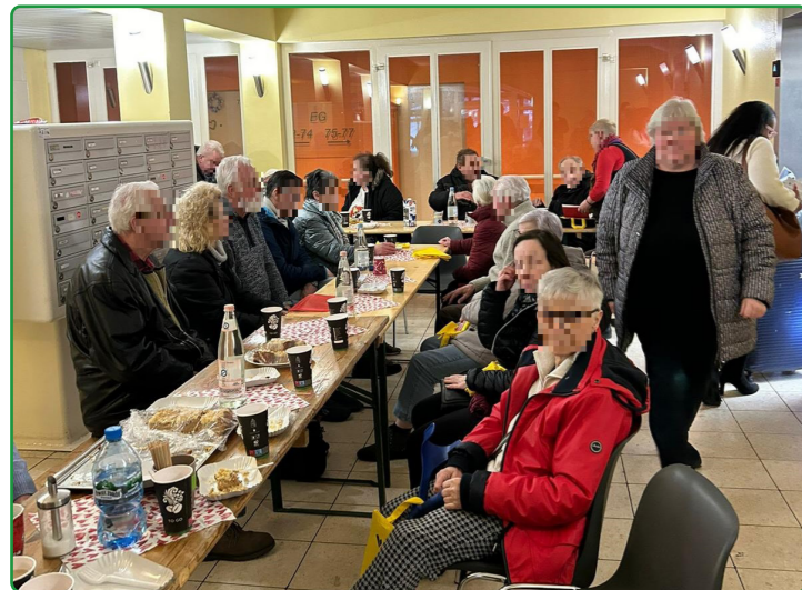
Bewohnertreffen in der Heinrich-Schlusnus-Straße 10, finanziert aus dem Aktionsfonds 2024

Am 14. und 26. Februar hatten aktive Bewohnerinnen gemeinsam mit dem QM die Nachbarinnen und Nachbarn aus dem Seniorenwohnhaus „Volière“ in der Heinrich-Schlusnus-Straße 8, 10 und 12 zu zwei Bewohnertreffen eingeladen. Bei Kaffee und Kuchen kamen viele Menschen miteinander ins Gespräch. Hier und da wurden sogar neue Bekanntschaften geschlossen. Die Bewohnerinnen und Bewohner hatten außerdem die Möglichkeit, Vertretenden der STADT UND LAND und der Polizei sowie dem QM-Team ihre Fragen zu stellen. Finanziert wurde das Treffen aus dem Aktionsfonds .