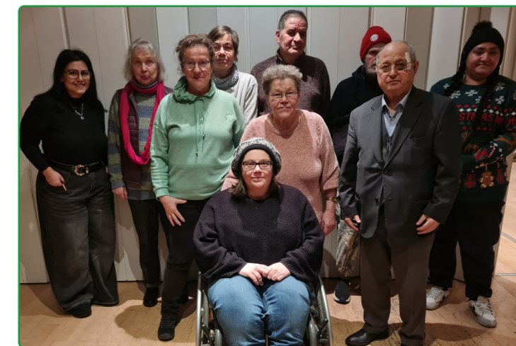
Aktionsfondsjury nach der Sitzung im Februar