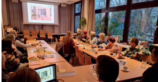
Quartiersratsitzung März 2026

In der zweiten Hälfte der Sitzung berichteten die Mitarbeitenden der AG.URBAN, was in dem QM-Projekt „Mehr Freizeit- und Bewegungsangebote für Erwachsene im Quartier“ bisher zusammengetragen wurde. Geplant sind die Wiederbelebung der Boule-Fläche, ein Freiluftkino auf einem High-Deck sowie Sportgeräte für Seniorinnen und Senioren. Im März startete mit dem gleichen Träger das neue QM-Projekt „Neue Lernorte“. In der High-Deck-Siedlung leben viele Menschen auf beengtem Raum. Häufig fehlen daher Rückzugsräume für ungestörtes Lernen. Ziel des Projekts ist es daher Lernorte im Quartier zu schaffen oder bereits bestehende Orte zu fördern und auszustatten. Diese Orte sollen Menschen jeden Alters zugutekommen. In dem gerade beginnenden Projekt werden bis Ende 2027 Raumausstattungen und -konzepte für ruhige Lernorte erarbeitet und zum Teil umgesetzt.